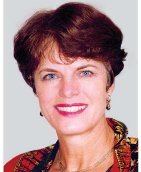
Prof Salome Kruger, Fakulteit Gesondheidswetenskappe, Cavemen's diet may solve obesity today, The Herald, 16 Mei 2013

“In 2012 het atlete van 35 verskillende lande die HPI (en ander fasiliteite van die NWU se Potchefstroomkampus) gebruik as hul voorkeur-oefenbestemming om voor te berei vir die Olimpiese Spele. Atlete wat in Potchefstroom geoefen het, het 19 medaljes by die Londen-spele ingeoes. Die instituut se grootste kliënte is onder meer atlete van Frankryk, Pole, Tsjeggië, Finland, Swede en Duitsland. ”