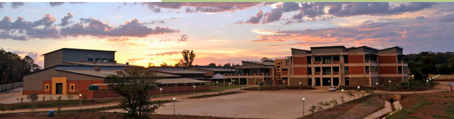
In sy volle glorie: Die splinternuwe, ultramoderne ingenieurskompleks is op die kant van die Potchefstroomkampus, langs die botaniese tuin, geleë.

Gaan kyk gerus op www.naturelandscaping.biz na die fotogalery. Klik op "portfolio" en dan op "corporate projects". Die storie van die ontwikkeling van die tuine word daar vertel.