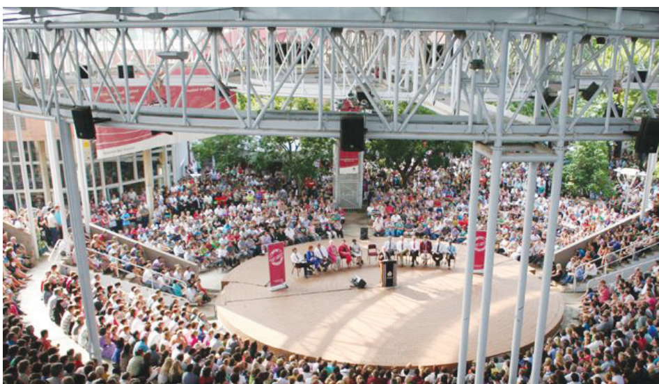
Mo Khamphaseng ya Potchefstroom, baithuti ba ngwaga wa ntlha le batsadi ba bone ba ne ba tletse ka dikago tsa khamphase ba rile thi! Baithuti le batsadi ba ne ba engwe ka lefoko mo bobogelong jwa khamphase.

Ka Lamatlatso wa di 29 Firikgong 2011, go ne ga amogelwa baithuti ba ngwaga wa ntlha ba ba fetang 1 700 mo Khamphaseng ya Khutlotharo ya Lekwa. Go ya ka Moreketoro wa Khamphase, e leng Mop Thanyani Mariba, palogotlhe ya baithuti mo khamphaseng e ntse e tlhatlogela godimo mo dingwageng di le tharo tse di fetileng, ka kgolo ya ba le 3 744 ka 2008 go fitlha go ya ba le 5 269 ka 2010. Go tlhaloganya dipalo tseno sentle, palogo-tlhe ya baithuti e fopholediwa go 1 000 mo dingwageng di le lesome tse di sa tswang go feta.