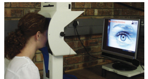
Oogvolginstrumente soos dié help die navorsers van UPSET om uit te vind hoe mense taal verstaan en prosesseer.

“Die toevoeging van UPSET tot die NWU se navorsingsentiteite-model bewys dat die Universiteit se strategiese verbintenis om sy navorsingsimpak nasionaal én internasionaal uit te brei, positiewe resultate lewer,” sê prof Bertus.