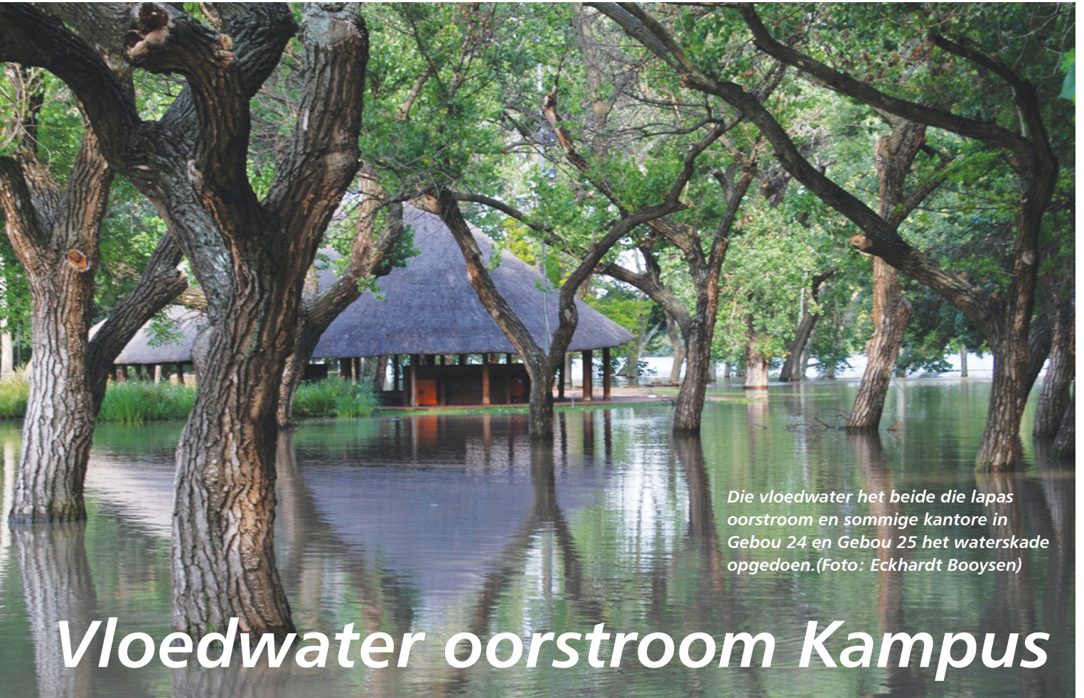
Die vloedwater het beide die lapas oorstrom en sommige kantore in Gebou 24 en Gebou 25 het waterskade opgedoen.