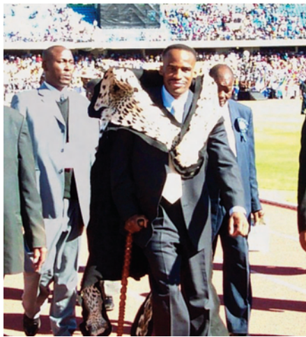
Kgosile Molotlegi is in 2003 gekroon as die regeerder van die Bafokeng-nasie.

Die Koninklike Bafokeng-nasie het al as borg opgetree vir verskeie akademiese en sportaangeleenthede – soos byvoorbeeld die NWU 54 Classic-gholfdag, waarvan die opbrengs aangewend word vir die Ete-per-Dag-projek op al drie kampusse.