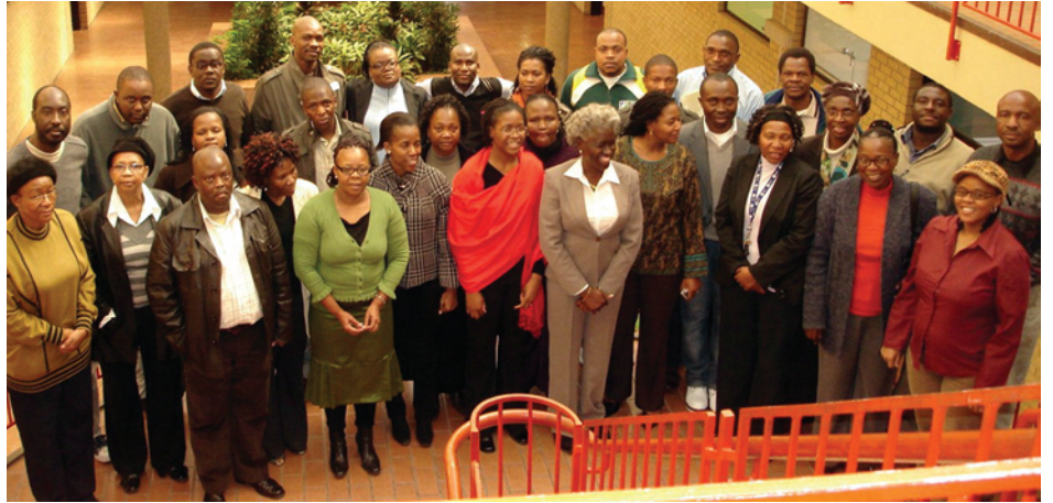
Personeel van die Mafikengkampus wat onlangs die Mediese Navorsingsraad se werkswinkel bygewoon het.

Die MNR het ook befonding verskaf aan NWU-personeellede van wie sommiges later vanjaar die jaarlikse wêreldkonferensie in Durban gaan bywoon.