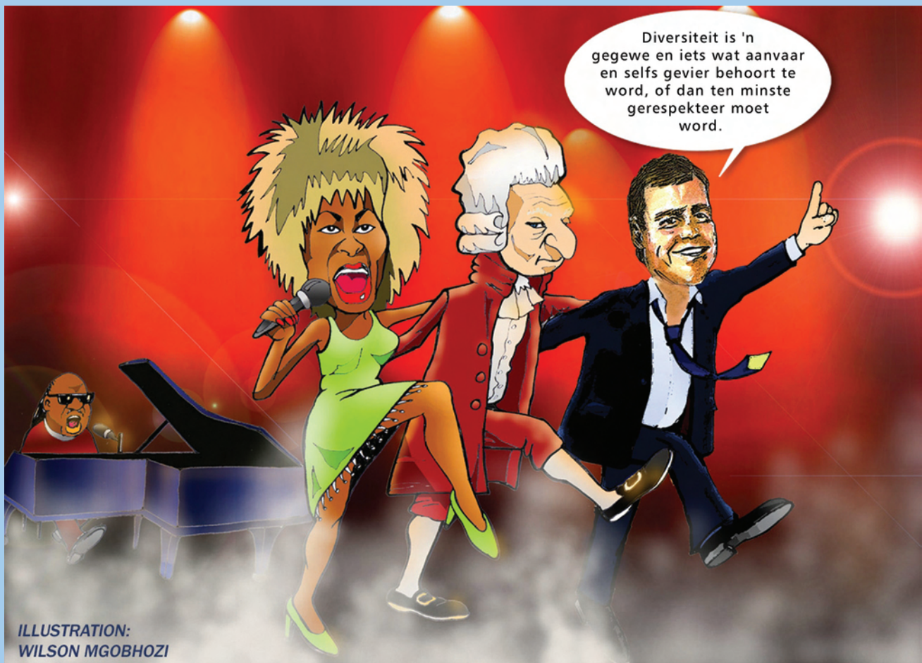
ILLUSTRATION: WILSON MGOBHOZI

* HEAIDS is 'n inisiatief van die Departement van Onderwys wat deur Hoër Onderwys Suid-Afrika (HESA) onderneem word, en word deur die Europese Unie befonds.