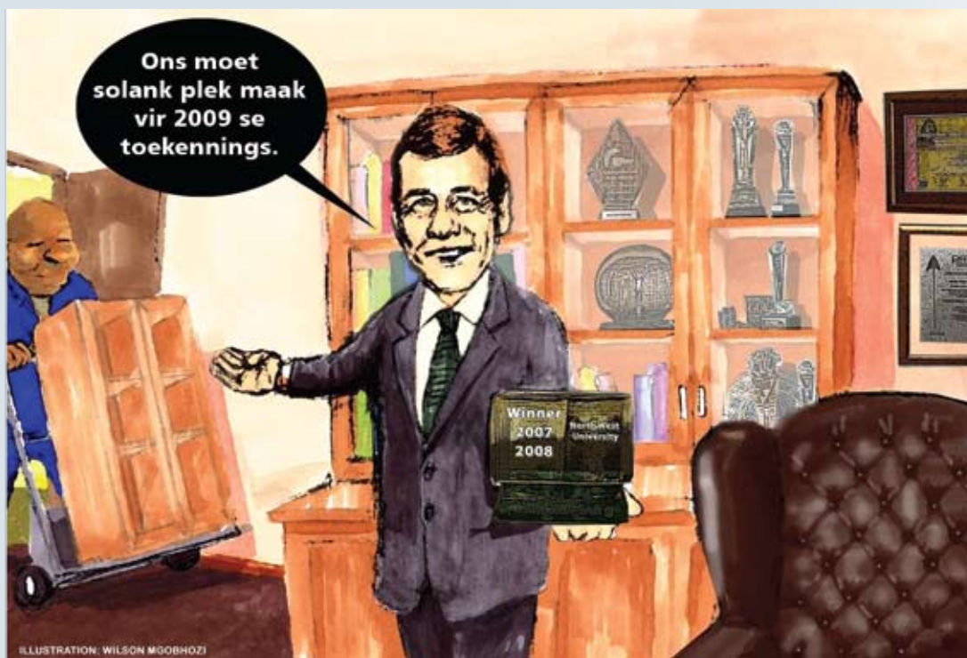
Die NWU het talle toekennings gedurende 2008 ingepalm en sal voortgaan om steeds hoër hoogtes te bereik, wat ons strewe onderskryf om 'n toonaangewende universiteit in en buite Afrika te word.