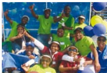
Personeellede van die drie kampusse en die Institusionele Kantoor geniet die sosiale dag.