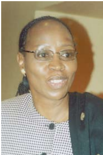
Dr Sankie Mthembu-Mahanyele

As die tyd dit toelaat, is dit vir my lekker om te lees en na musiek te luister.